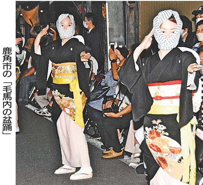
鹿角市の「毛馬内の盆踊」

風流踊は華やかな衣装をまとい、太鼓や笛のはやし、歌に合わせて踊るのが共通の特徴。豊作祈願や厄災払い、先祖供養など地域の歴史や風土を反映した祈りが込められている。日本三大盆踊りである「郡上踊」（岐阜）や「西馬音内の盆踊」（羽後町）に加え、本県の「毛馬内の盆踊」（鹿角市）が含まれ、いずれも国の重要無形民俗文化財に指定されている。